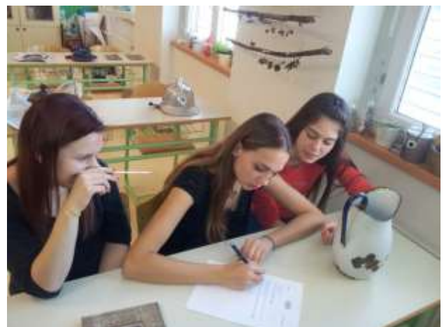
Zbiranje fotografij in predmetov ter popis muzejskega gradiva na raziskovalnem taboru.