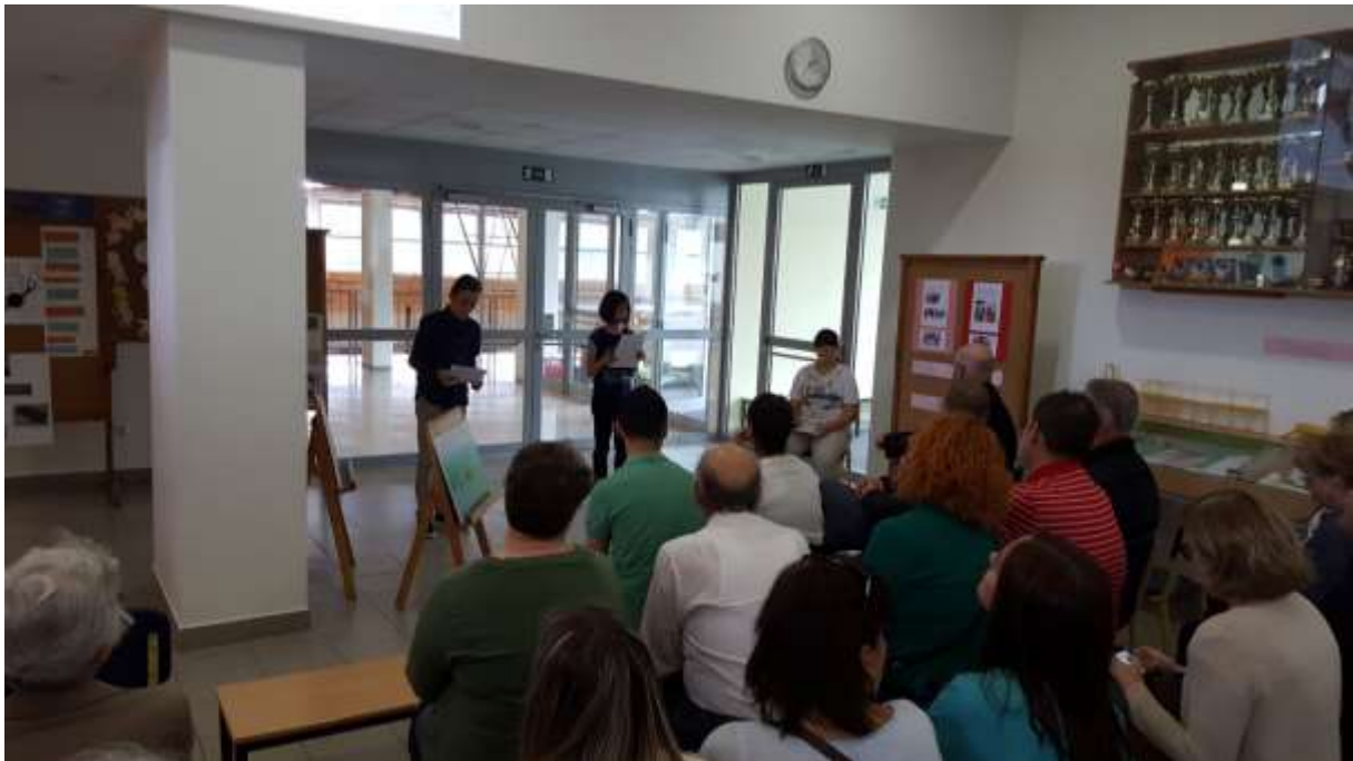
Otvoritev razstave Podobe našega kraja – Pesnica skozi čas, Pesnica, 17. 5. 2017