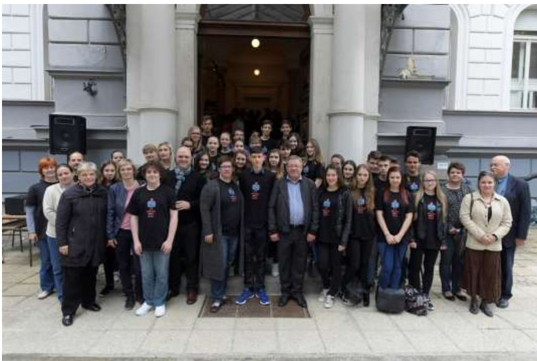
Vsi sodelujoči v projektu Prevezli smo muzej pred Muzejem NO Maribor, 17. maj 2016