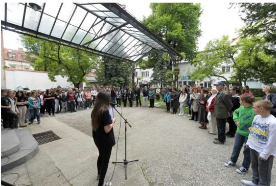
Slavnostna otvoritev razstave Podobe našega kraja – Pesnica skozi čas, 17. maj 2016