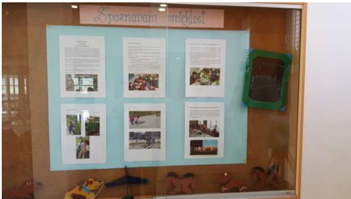
Utrinki iz projekta Spoznavam preteklost ...