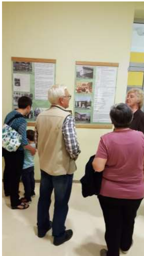
Razstava v prostorih