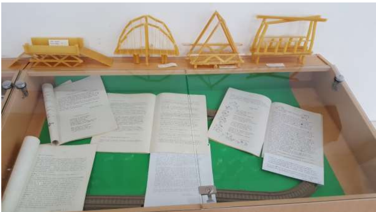
Izdelki učencev, ki jim je bila razstava navdih, šol. leto 2016/17