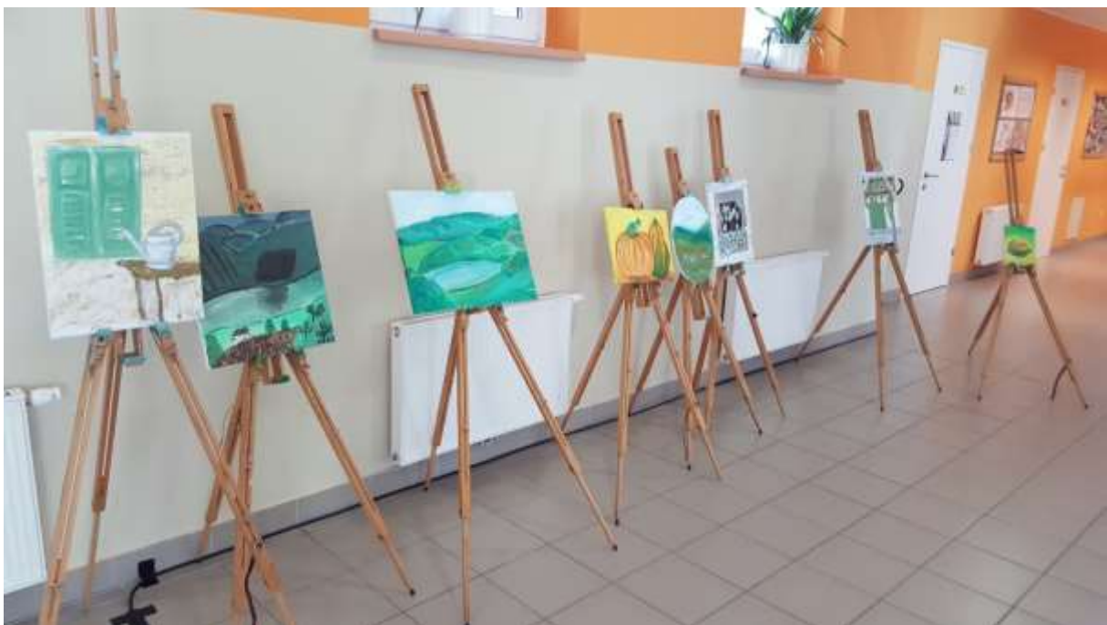
Razstava likovnih izdelkov Po poteh Ferdinanda Maliča