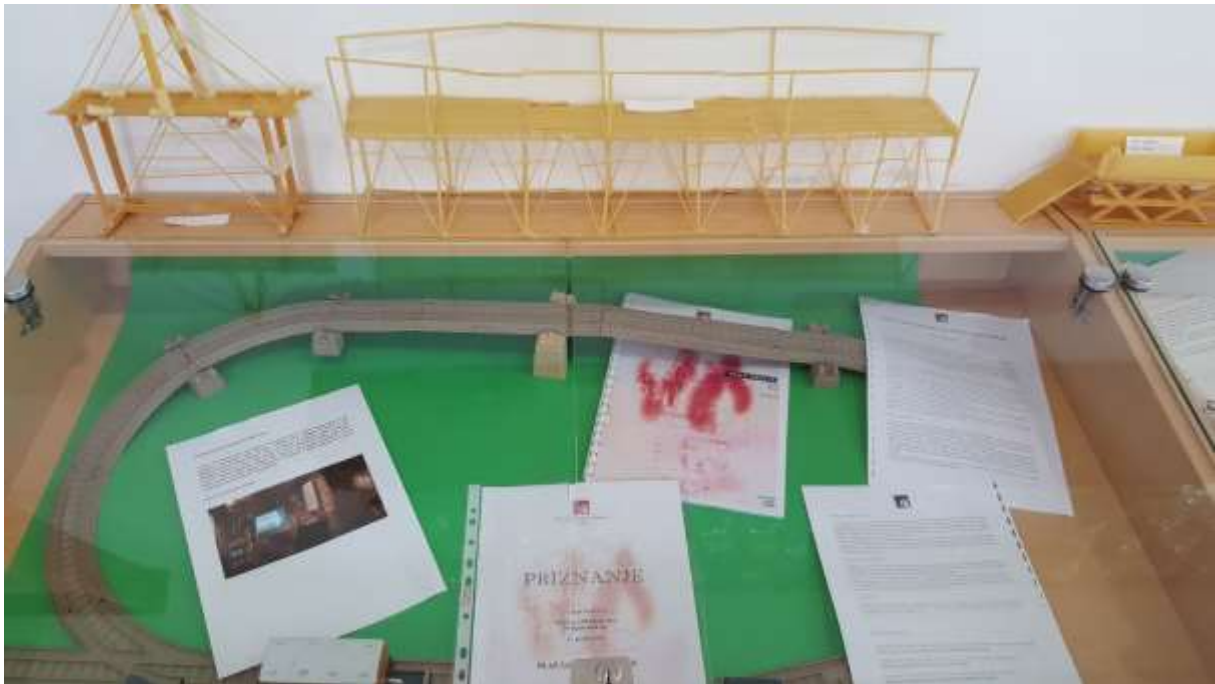
Pesniški viadukt iz špaget in na zgodovinskem simpoziju